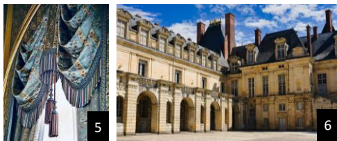
(1) - (2) Château de Versailles (3) - (6) Château de Fontainebleau