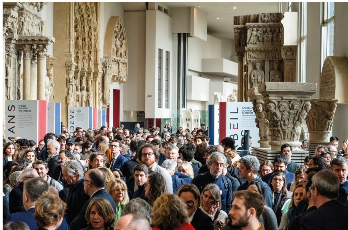
Vernissage de l'exposition Quartiers de demain .