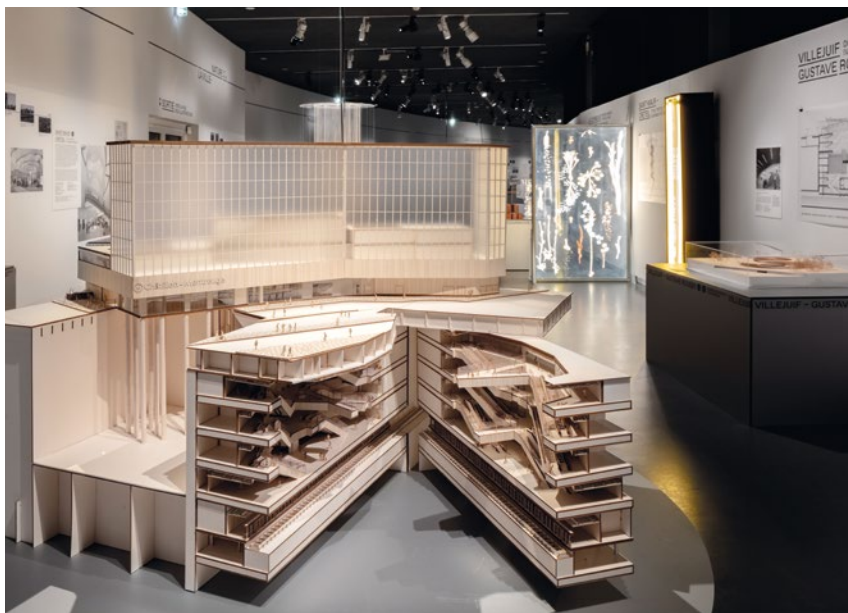
De gauche à droite : Vue de la Galerie d'architecture médiévale et classique.