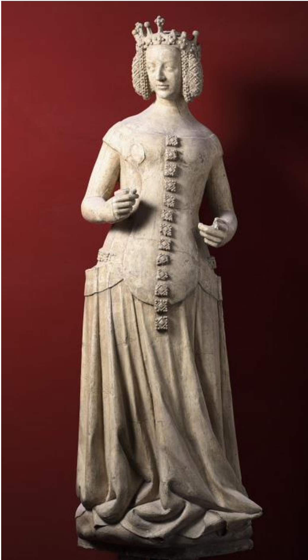
Isabeau de Bavière POITIERS (Vienne), PALAIS DE JUSTICE La « Belle cheminée » Entre 1389 et 1393 Moulage en plâtre 1888