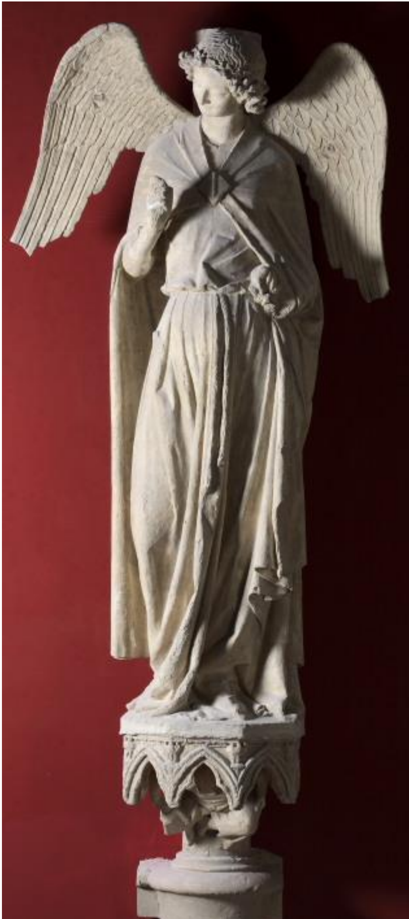
L'Ange au sourire REIMS (Marne) CATHÉDRALE NOTRE-DAME Statue de l'ébrasement du portail nord de façade occidentale Vers 1230 Moulage en plâtre 1881