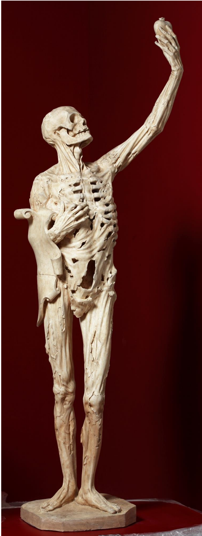
Transi de René de Chalon BAR-LE-DUC (Meuse), ÉGLISE COLLÉGIALE SAINT-MAXE Milieu du XVIe siècle Œuvre originale de Ligier Richier Moulage 1948