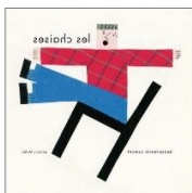
Les chaises Louise Marie Curmont Editions Memo Album

Fitgi quitte son terrier en forêt pour s'installer dans une vraie maison avec une porte et une fenêtre. Heureux et fier, il invite son ami Burno à déguster une bonne purée de racines et tous deux s'assoient sur la table - le seul meuble de la maison. Mais voilà que la jolie Maggie passe par là et vient semer le trouble. Elle affirme qu'une table est faite pour poser des choses dessus, et que, pour s'asseoir, il faut une chaise. Une chaise ? Mais qu'est-ce qu'une chaise ? s'interrogent les deux amis un peu confus.