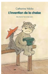
L'Invention de la chaise Catharina Valckx Editions de l'école des loisirs Roman pour les 7 à 10 ans

Ce jour-là, Escarbille et Chaboudo se promenaient dans le désert. Et dans le désert, il n'y avait rien. Rien, sauf...une tache bleue, au loin. Ils s'approchèrent : c'était une chaise. C'est fou ce qu'on peut faire avec une chaise bleue.