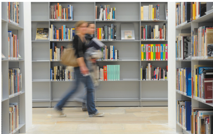
Bibliothèque de la Cité

A distance : les bibliothécaires vous répondent également par mail à l'adresse bibliotheque@citedelarchitecture.fr