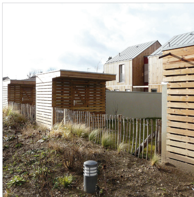
Logements et îlot Frassati, Courtry, 77 Photo : atelier da.u

Maître d'ouvrage : FSM Les foyers de Seine et Marne pour les logements ; Ville de Courtry pour les espaces publics Maître d'œuvre : atelier da.u – Pascal Arsène-Henry et Philippe Dandrel