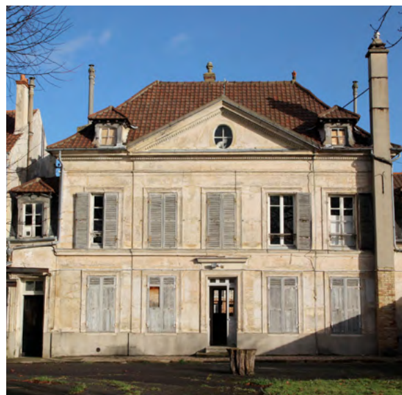
Façade musée du plâtre, Cormeilles-en-Paris

Courriel : delphine.aboulker@citedelarchitecture.fr / lydie.fouilloux@citedelarchitecture.fr