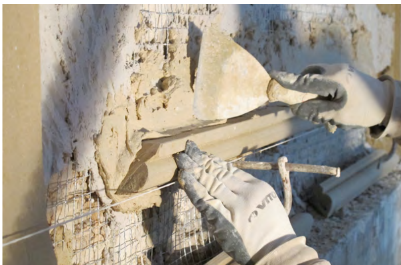
Hôtel des Ambassadeurs de Hollande, Paris

En partenariat avec l'Association des Architectes du Patrimoine