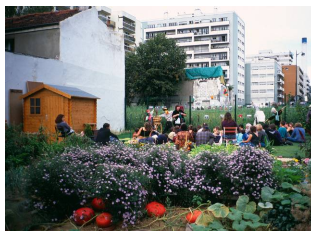
Un conte au jardin partagé pendant la Fête des Jardins, Paris, France