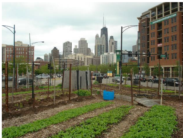
Jardin partagé dans la ville de Chicago / États-Unis