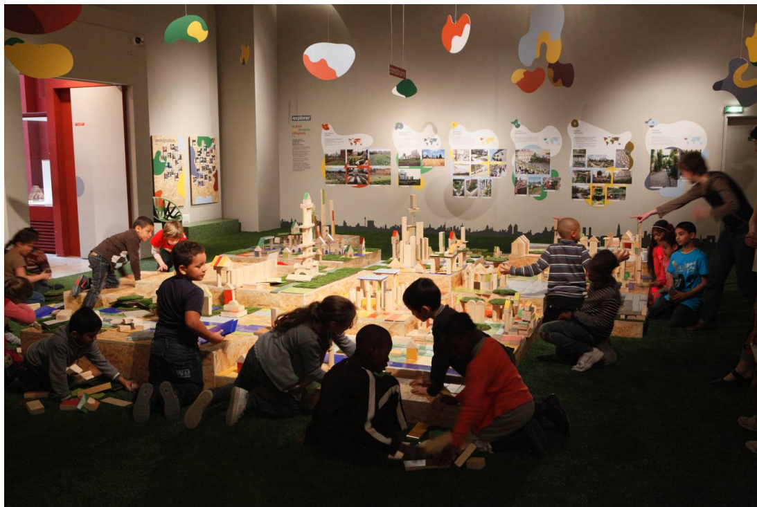
Gaston Bergeret © Cité de l'architecture & du patrimoine

La Cité de l'architecture & du patrimoine formera les animateurs sur place avant ouverture au public. Un dossier de médiation sera fourni à l'emprunteur.