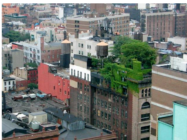
Immeuble chevelu, Manhattan, New-York, États-Unis