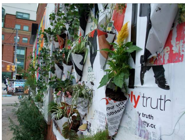
Poster Pocket Plants, Toronto, Canada © Eric Cheung & Sean Martindale