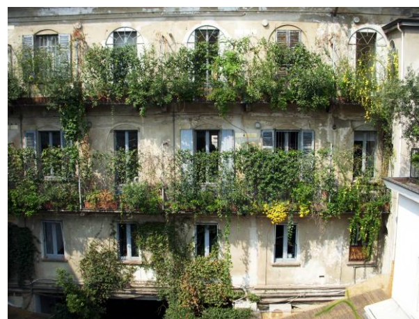
Balcons fleuris, Milan, Italie