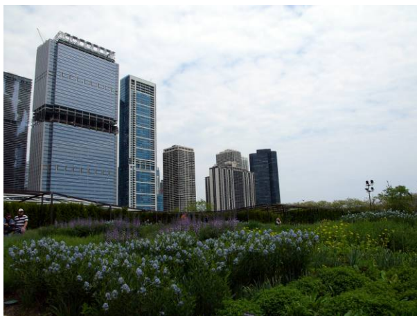
Fleurs sauvages au Lurie Garden, Millennium Park, Chicago, États-Unis