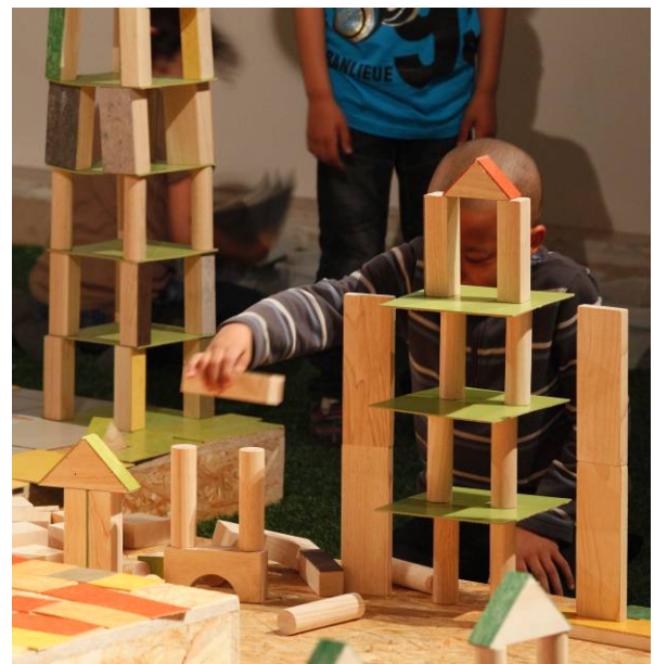
Gaston Bergeret © Cité de l'architecture & du patrimoine