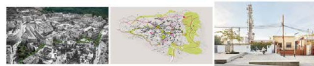
A000152_Estrategia desarrollo urbano Habitat Saludable_Es CHRY... A000153_Estrategia desarrollo urbano Habitat Saludable_Es CHRY... A000150_Calle Pizarra_Boracaina_Bosch Capolupo, Fotos Jose He...