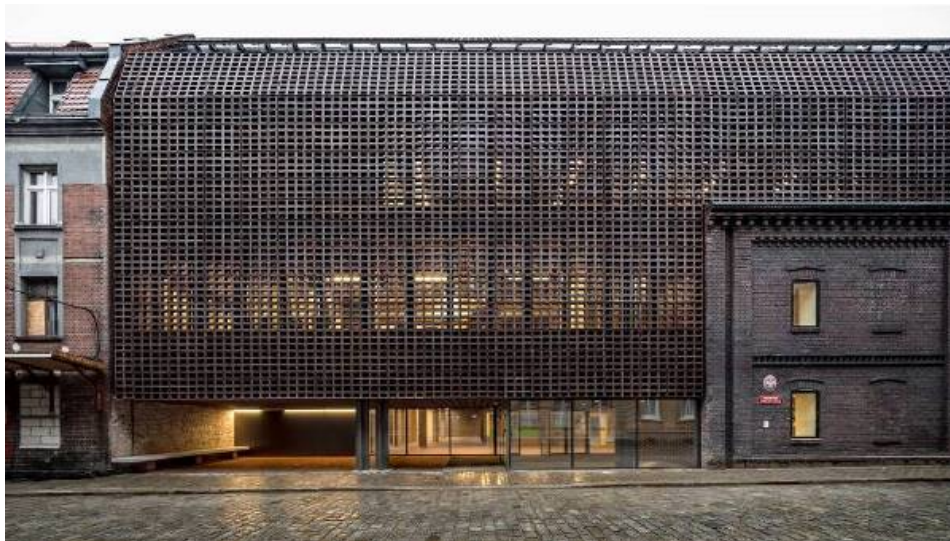
Département de radio et télévision, Université de Silésie, Katowice, Pologne. BAAS arquitectura.

Paris, le 3 mai 2019. Le meilleur de l'architecture espagnole sera exposée à Paris du 12 juin au 19 juillet. C'est l'Instituto Cervantes de la capitale française qui accueillera l'exposition des projets lauréats de la quatorzième édition de la Biennale Espagnole d'Architecture et d'Urbanisme (BEAU). Sous le titre « Habiter plus, humaniser davantage » l'exposition permettra de voir les meilleurs travaux réalisés en Espagne, par des architectes espagnols ou internationaux mais aussi des travaux d'architectes espagnols réalisés dans d'autres pays. Concrètement, les vingt-trois œuvres récompensées dans le cadre de l'appel à projets Œuvres d'architecture et les vingt-six récompensées dans le cadre de l'appel à projets Recherche (quatre dans la catégorie Production et vingt-deux dans la catégorie Publications).