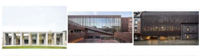
M00000000_Edificio ciudad deportiva Morat_Un panel d'arquitect... OUA00772_Sleiss University_Ireland_BAAS Arq, Grupo 5 Architects... OUA00771_Sleiss University_Ireland_BAAS Arq, Grupo 5 Architects...