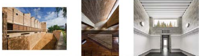
M400052_Archivo Historico Oaxaca_Mexico_Ignacio Mendez, Fo... M400051_Archivo Historico Oaxaca_Mexico_Ignacio Mendez, Fo... M00000000_Edificio ciudad deportiva Morat_Un panel d'arquitect...