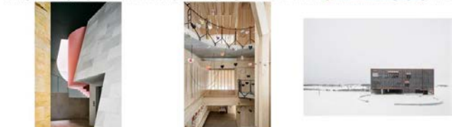
IDP0122_110 Rooms Vivienda Privada_BCN_IJAO_Soto Jose He... M401042_Escola en Orosmanis_Soto_TETA Arq, Joana Mayol e... M401043_Escola en Orosmanis_Soto_TETA Arq, Joana Mayol e...