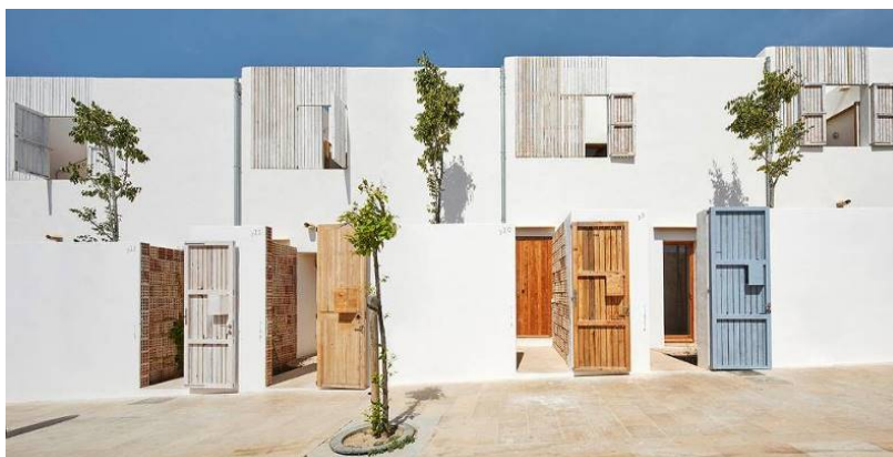
Life Reusing Posidonia, Formentera Arquitectos del Instituto Balear de la Vivienda (IBAVI).