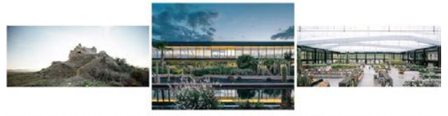
ENR000023_Recuperacion acceso Castillo Jarbo_Jarbo, Barcelona, Ca... GAR00212_Desert City_S.S. de los Reyes, Madrid_Jacobo Garcia G... GAR00221_Desert City_S.S. de los Reyes, Madrid_Jacobo Garcia G...