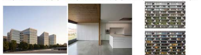
GUT000008_Oficina Consuegra Foments calle Pizarra_Sevilla_Cruz... IAR000572_Habitat la fachada_Ripagaina, Pamplona_Javier Larraz An... IAR000002_Habitat la fachada_Ripagaina, Pamplona_Javier Larraz An...