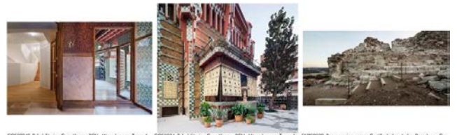
CC002042_Rehabilitacion Casa Vicens_BCN_Mireia Laporta_Tayres A... CC002044_Rehabilitacion Casa Vicens_BCN_Mireia Laporta_Tayres A... ENR000022_Recuperacion acceso Castillo Jarbo_Jarbo, Barcelona, Ca...