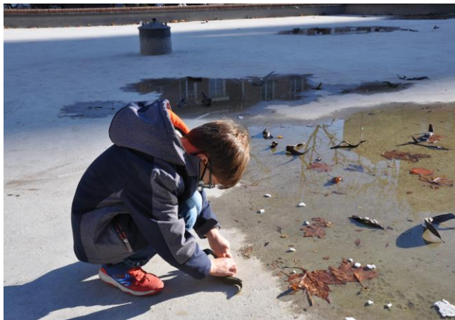
4. Mise en scène et prise de vue