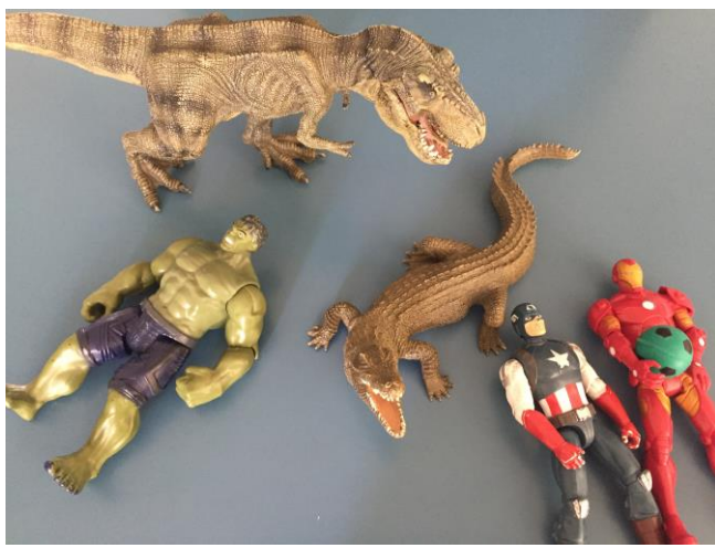
1. Choix des personnages